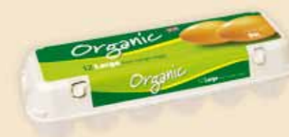
Mini Poster Pack™ 12 uova – E5412