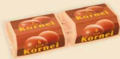
Superface® 6 uova – E7412