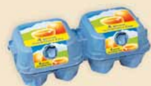
Mini Poster Pack™ 4 uova – E6608

Direttamente stampato come Plus Pack™ o dotato di una etichetta di alta classe come Mini Poster Pack™ , questa serie di confezioni in 7 differenti grandezze è indicata per tutte le gamme. Innumerevoli le possibilità di personalizzazione che creano un assortimento accattivante nei segmenti medi e bassi.