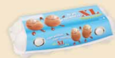
imagic® MAX 10 uova – E9410