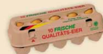
Fresh Pack™ 10 uova – E3810