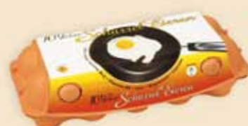
imagic® 10 uova – E9910