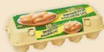
Mini Poster Pack™ 10 uova – E3310