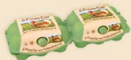
imagic® 6 uova – E9812

Per uova XL, forniamo il coloratissimo imagic® MAX in 2 grandezze. Le eccellenti caratteristiche che lo distinguono sul mercato vengono rinforzate con etichette altamente professionali.