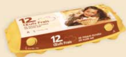
imagic® 12 uova – E9212