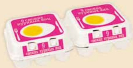
Plus Pack™ 9 uova – E7918