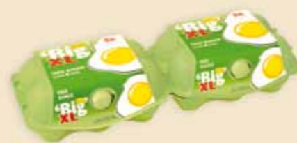
imagic® MAX 6 uova – E9312