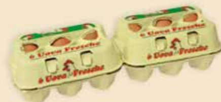
Fresh Pack™ 6 uova – E4912

Con la stampa a forti colori, parla in maniera chiara e convincente. Questo imballaggio in 2 grandezze con le sue aperture sul coperchio indica e porta freschezza nel segmento a più basso valore.