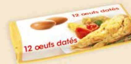
Superface® 12 uova – E7312