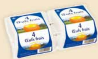
Superface® 4 uova – E7108

Noi forniamo qualità di prima classe in 4 grandezze, 8 colori e con etichette di elevata qualità. Il prodotto Premium, con la più grande superficie per la comunicazione è indicato sia per uova di marca che per le specialità. L' impatto visivo e d' attrazione negli scaffali è notevolissimo.