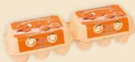
Mini Poster Pack™ 6 uova – E5312