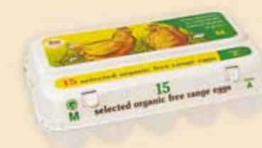
Plus Pack™ 15 uova – E5915