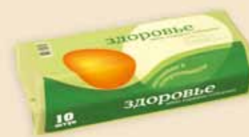
Superface® 10 uova – E7210