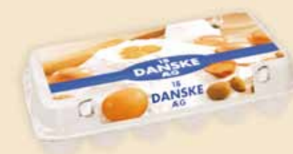
Mini Poster Pack™ 18 uova – E3918